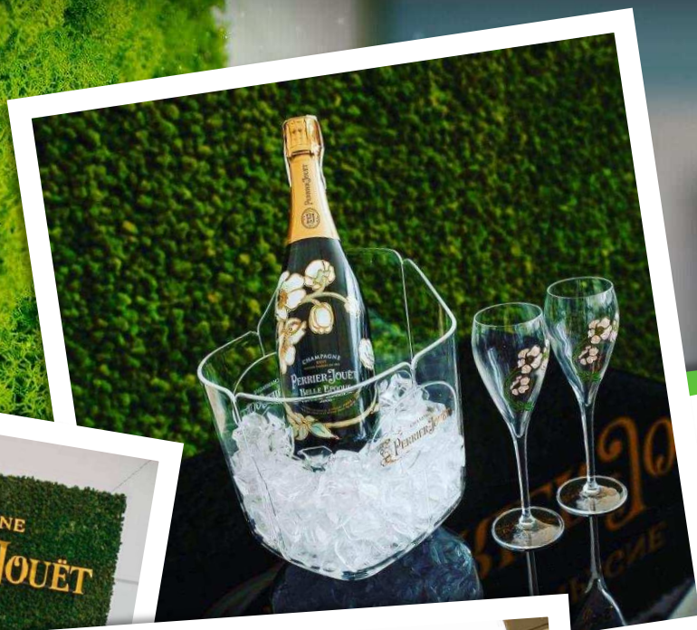
ФОТО НАШИХ РАБОТ: